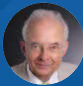
Prof. Dr. Paul Kirchhof